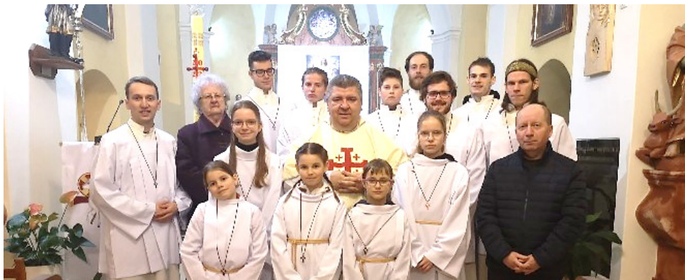
So sakristiovou zostavou s p. kostolníčkou, akolytmi, miništrantmi a miništrantkami