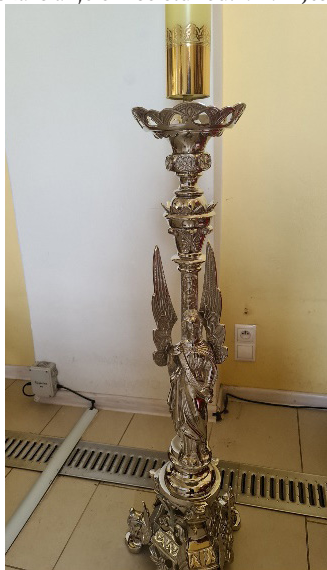
Nový svietnik pod paškál – dar Ružencového bratstva pre farský kostol