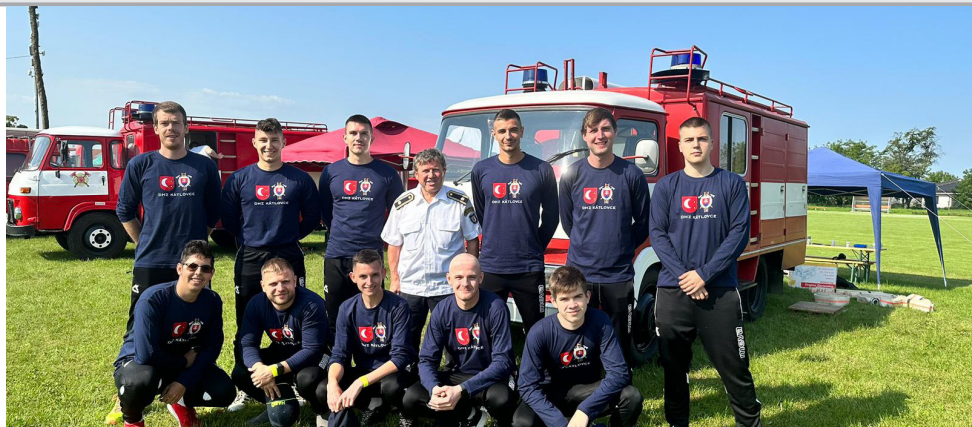
Na Územnom kole hasičskej súťaže mužov, žien a dorastu ÚZO DPO SR Trnava 27. 5. 2023 vo Vlčkovciach súťažné družstvo DHZ Kátlovce obsadilo 4. miesto

Dňa 8. 5. 2023 sa náš dobrovoľný hasičský zbor zúčastnil inštruktážno-metodického zamestnania (IMZ) – Požiar lesa v lokalite Pod Mariaš – pri kúpalisku na Dobrej Vode, ktoré zorganizovalo DHZ Dobrá Voda.