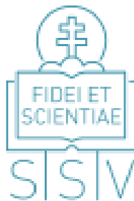
Logo spolku sv. Vojtecha v Trnave

Drahí moji! Nech našou službou v Cirkvi pripevňujeme k obohateniu Cirkvi. Amen.