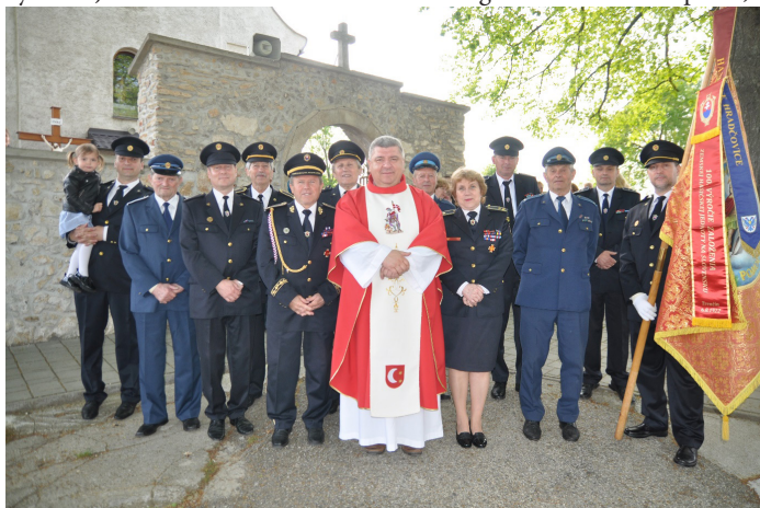
Drahí moji! Buďte vždy Bohu na slávu - blížnemu na pomoc! 8 Amen.

roční synovia - so starou mamou len tesne unikli pred plameňmi. Takmer som dostal infarkt, keď mi v tom volal aj starší syn. Povedal: Neboj sa, oco, my ten požiar so starkou uhasíme. Požiar dreva skutočne uhasili, no horelo aj na druhom mieste - celá strecha sa ocitla v plameňoch. Keď som prišiel, zobral som hadicu a hasil som. Synovia stáli v pyžamách a v deke na chodníku. Zachraňoval som, čo sa dalo. Len nedávno som dom zrekonštruoval. Pred rokom som si zobral na to úver. Dokonca garáž, kde vo voľnom čase opravujem autá, ešte nebola úplne dokončená, hovorí smutne dvojnásobný otecko, ktorý sa už takmer rok stará sám o dvoch synov. Pomocnú ruku mu v núdzi podali mnohí dobrí ľudia. Požiar založil muž, ktorý hasičovi pomáhal pri dokončovaní garáže a prespával aj so ženou na jeho pozemku v maringotke. 7 Pán Boh dopustil, ale neopustil!