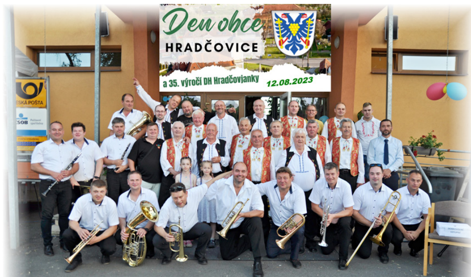
Dechová hudba Hradčovianka, Mužská spevácka skupina Kátlovani a Mužský spevácky zbor Hradčovice