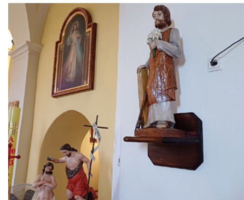
Nové umiestnenie sochy sv. Jozefa nad krstiteľnicou vo farskom kostole