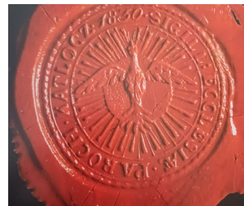
Odtlačok kátlovského farského typária