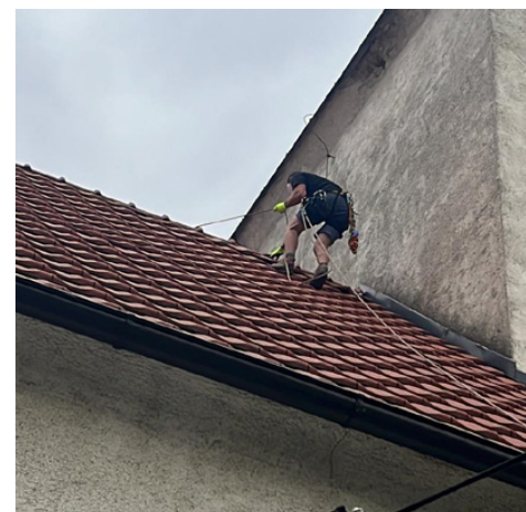
Michal Vittek opravuje poškodenú strechu po bocianoch