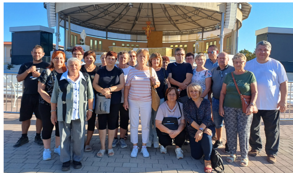
Kátlovskí účastníci púte v Medjugorje