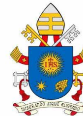
Osobný erb pápeža Františka

V modlitbách za jeho zdravie a plný návrat ku každodenným povinnostiam budeme za neho stále pokračovať!