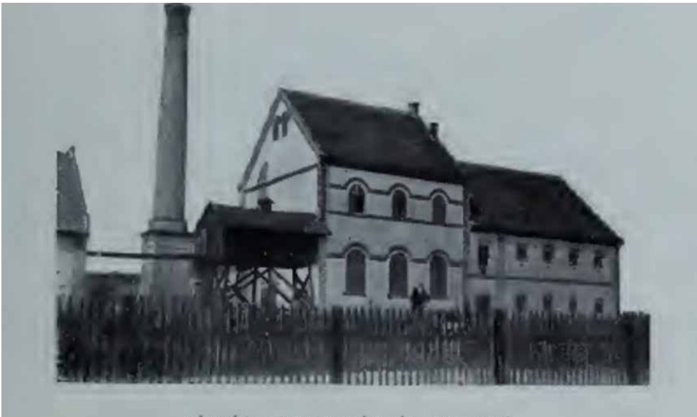
Kátlovský liehovar z roku 1896 objavený v maďarských archívoch