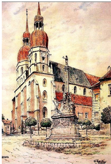
VOTLUČKA, K. Farský kostol sv. Mikuláša 3

na božskú čnosť nádeje, s ktorou chcete stále kráčať dopredu pod ochranou Panny Márie: Nech sa páči!