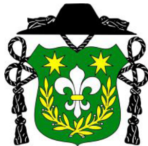
Erb Smolenického dekanátu

Pravidelné mesačné rekolekcie sú stretnutím všetkých pastoračných kňazov pôsobiach vo farnostiach v danom cirkevnom obvode. Naša kátlovská farnosť patrí do dekanátu Smolenice v Trnavskej arcidiecéze, z čoho sa odvodzuje aj náš farský erb: Holubica symbolizuje náš Farský kostol Svätého Ducha; dva vavrínové vence pod ňou sú prináležiace k erbú Smolenického dekanátu a napokon dve sedemcípce hviezdy sú prevzaté z erbú Trnavskej arcidiecézy. K nášmu dekanátu patria farnosti a ich filiálky: 1. Boleráz (Kľčovany), 2. Buková, 3. Dechtice, 4. Dlhá (Borová), 5. Dobrá Voda, 6. Dolná Krupá (Horná Krupá), 7. Dolné Dubové (Radošovce), 8. Dolné Orešany, 9. Horné Orešany (Lošonec), 10. Jaslovské Bohunice (Paderovce), 11. Naháč (Horné Dubové), 12. Smolenice (Smolenická Nová Ves), 13. Trstín (Bíňovce). Na rekolekciách 7. januára v Kátlovcach sa nezúčastnili pre chorobu kňazi z Bukovej, Dolného Dubového a Naháča.