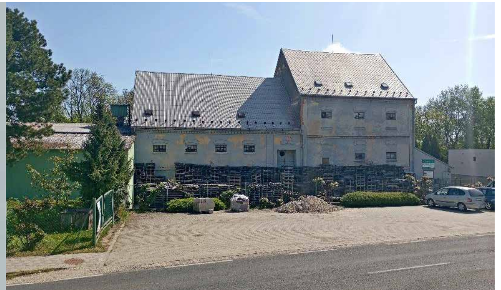
Dnes je komplex bez komína a zdá sa, že na jeho mieste bola prestavená budova vpravo nachádzajúca sa na starej fotografii.