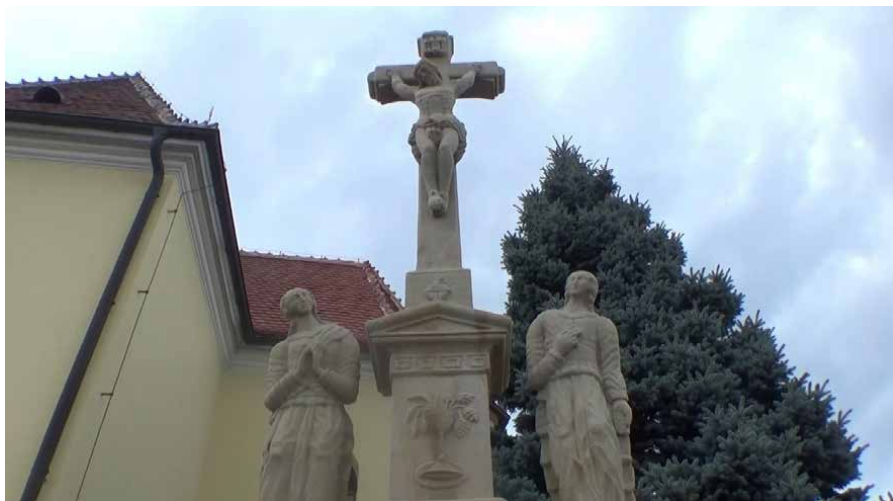
Požehnané obnovené súsošie Svätého Kríža, Panny Márie a sv. Jána z 10.augusta 2024 pred Farským kostolom Všetkých svätých v Hradčoviciach